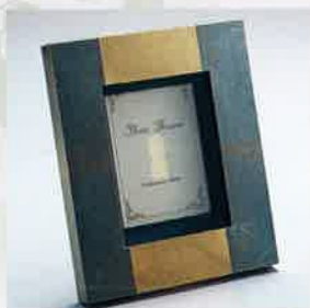
●T11-26 華緑 スクウェアピクチャー 205×170×20mm ¥3,500