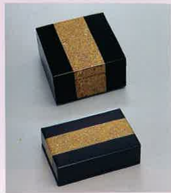
●T09-11 古代名刺箱 113×78×33mm ¥2,700