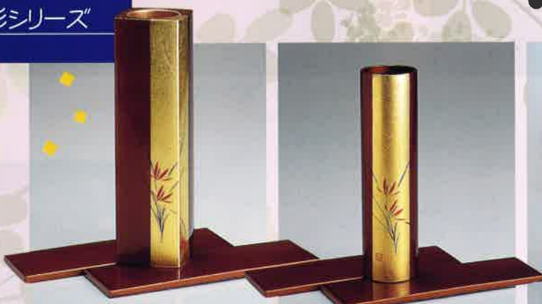
●T09-12 金彩角花生 73×73×250mm 花台付 ¥6,000