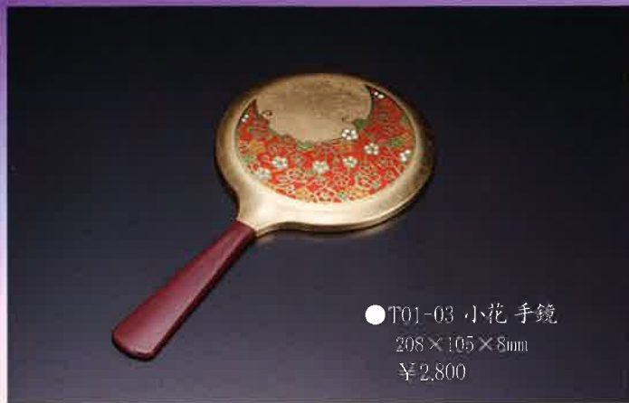
●T01-03 小花手鏡 208×105×8mm ¥2,800