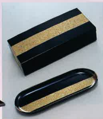
●T09-09 古代フリートレー 252×98×17mm ¥1,800