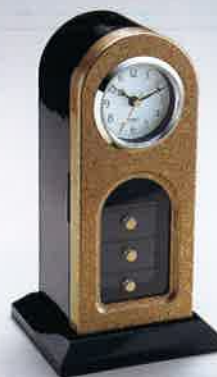
●T11-27 古代 ファンシーウォーツ 310×165×15mm ¥8,000