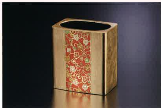
●T01-02 小花フリースタンド 92×84×55mm ¥2,800