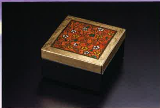
●T01-05 小花パフュームBOX 90×90×53mm ¥2,500