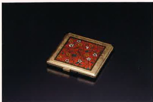
●T01-04 小花コンパクトミラー 70×70×9mm ¥2,000