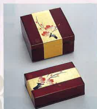
●T09-17 金彩名刺箱 113×78×33mm ¥3,000