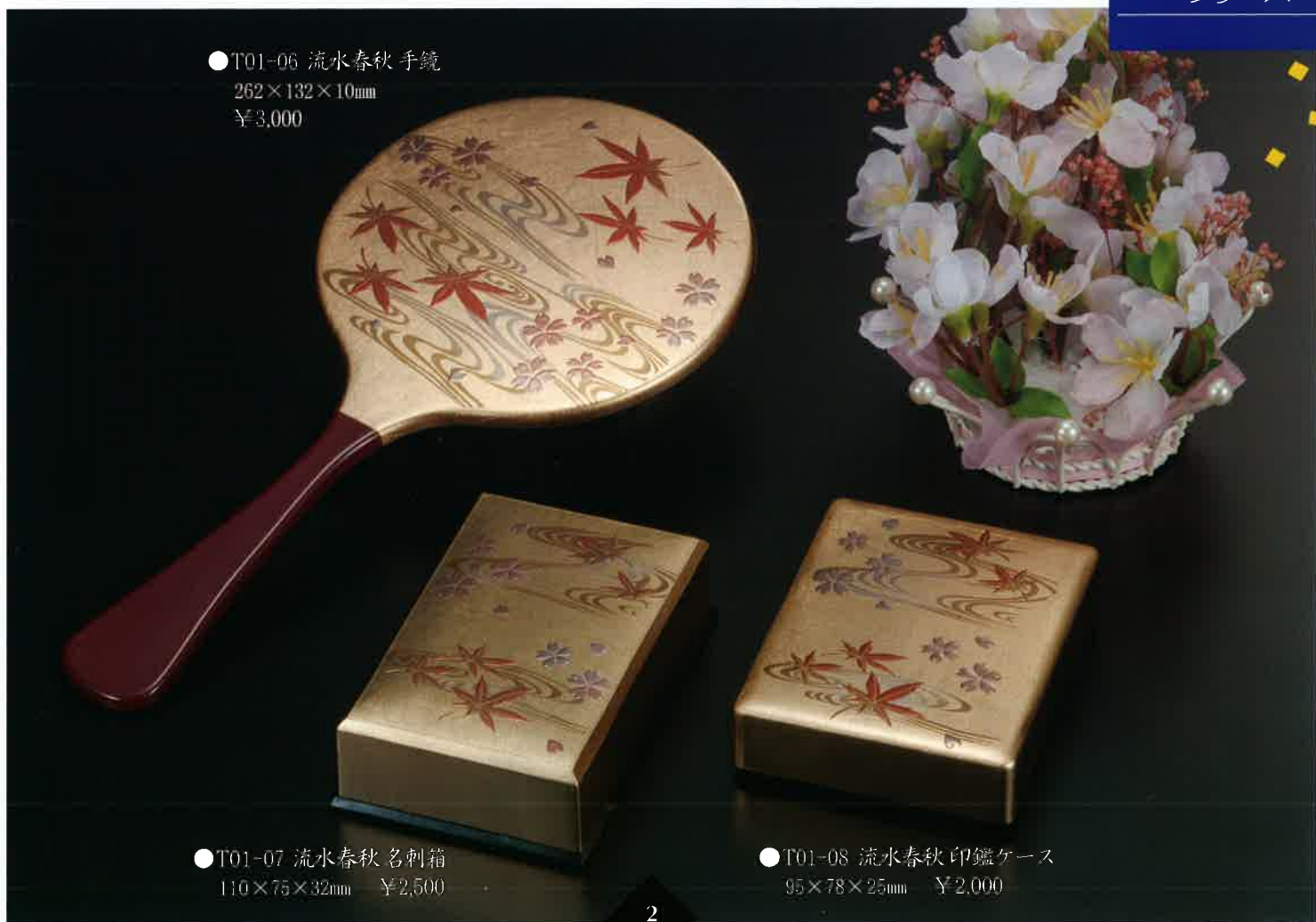
●T01-06 流水春秋手鏡 262×132×10mm ¥3,000