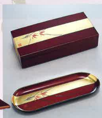
●T09-15 金彩フリートレー 252×98×17mm ¥2,000